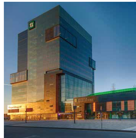
Campus de Longueuil