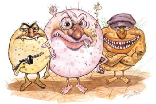
Illustration: Don Smith