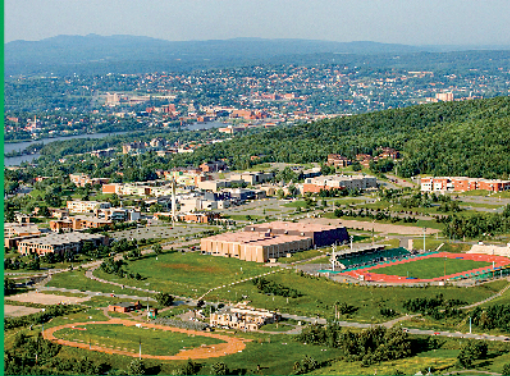
CAMPUS PRINCIPAL DE SHERBROOKE