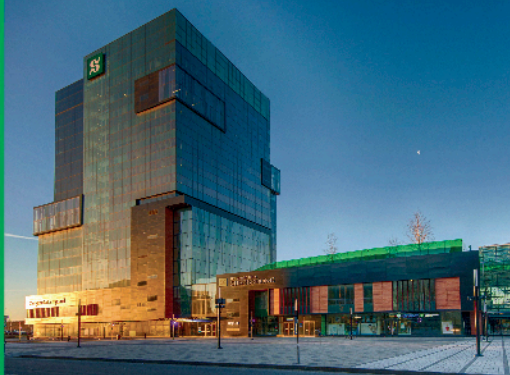
CAMPUS DE LONGUEUIL