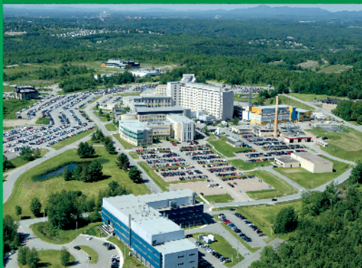
CAMPUS DE LA SANTÉ DE SHERBROOKE