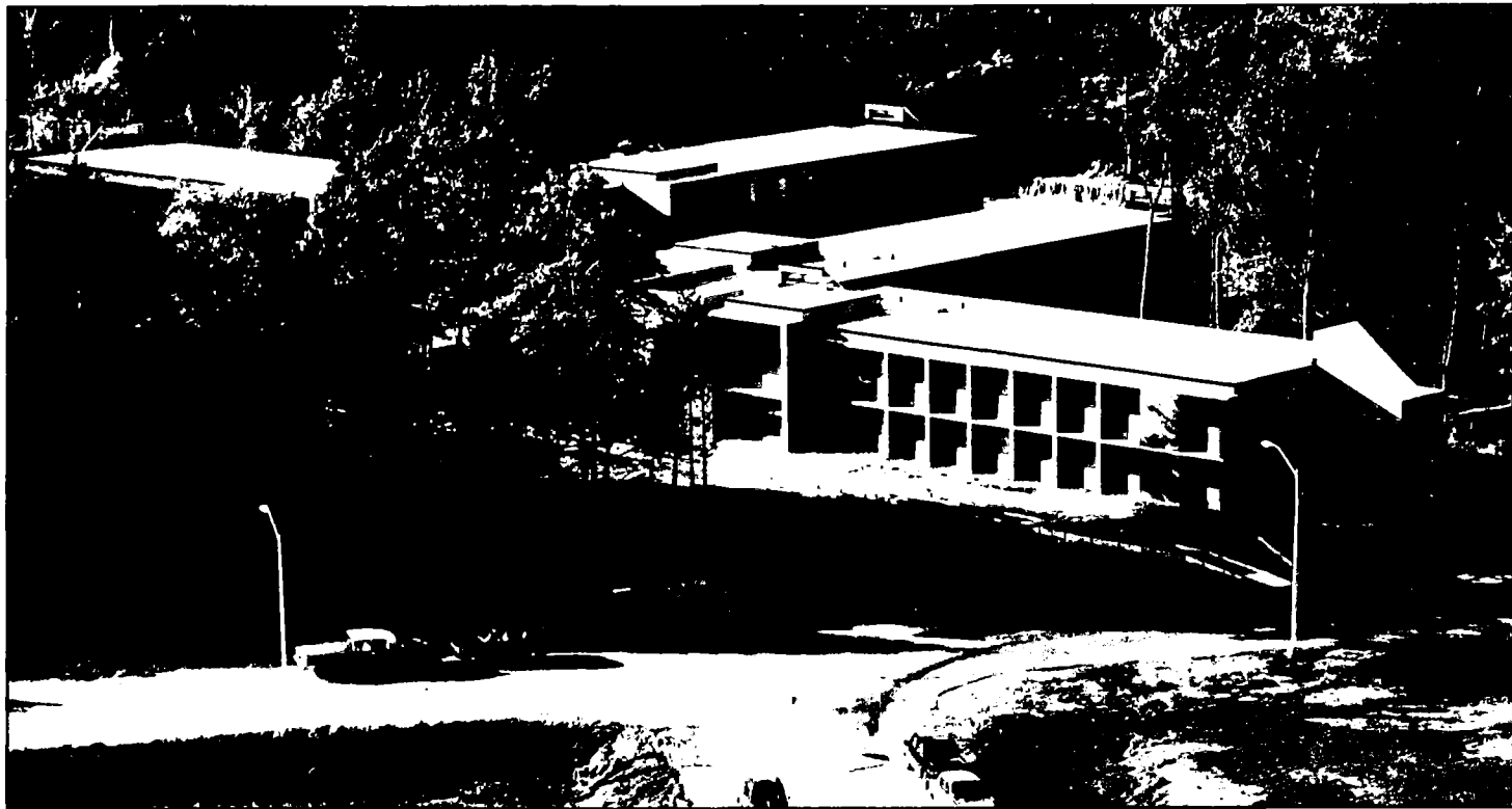
RÉSIDENCE DES ÉTUDIANTS AU C.H.U.