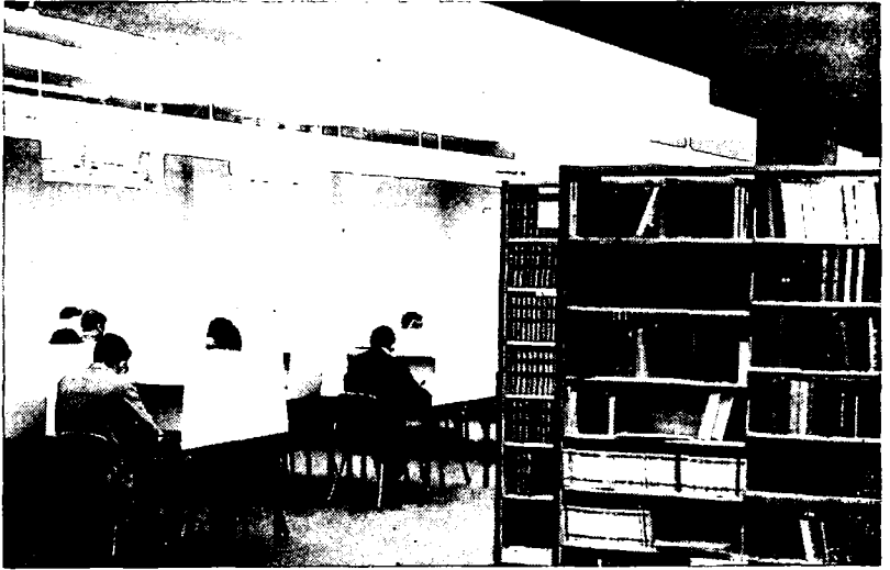
LA BIBLIOTHÈQUE DU DROIT