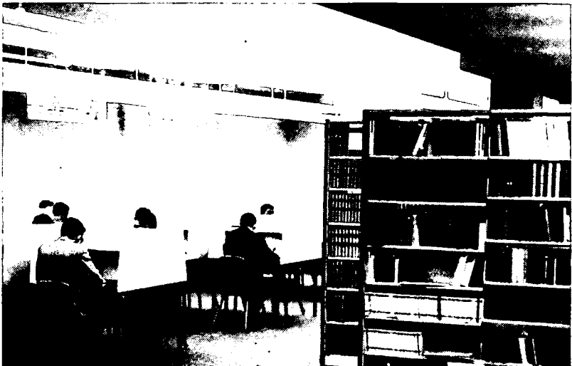
LA BIBLIOTHÈQUE DU DROIT