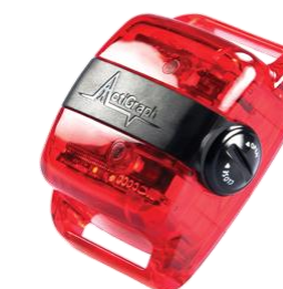
Accéléromètres Actigraph GT3X+