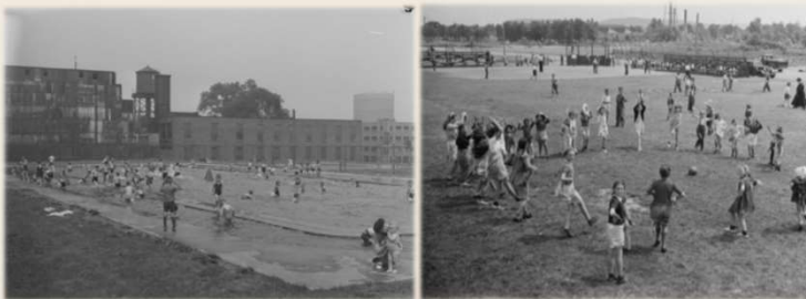
Terrains de jeux de l'avenue Henri-Julien à Montréal en 1945.