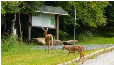
Entrée du parc du Mont-Bellevue

➤ Accès à l'entrée du parc du Mont-Bellevue près des résidences G, en passant par le Centre culturel, puis entre la Faculté de génie et la Faculté des sciences vers l'École de musique.