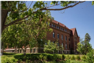
Site du Saguenay-Lac-Saint-Jean