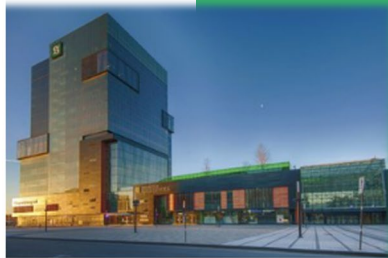
Campus de Longueuil