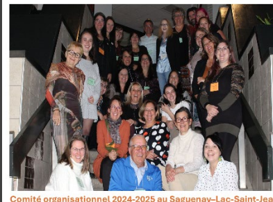
Comité organisationnel 2024-2025 au Saguenay-Lac-Saint-Jean