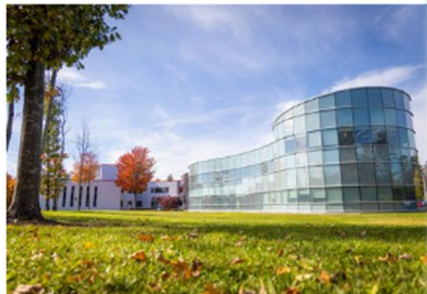
Site de Moncton