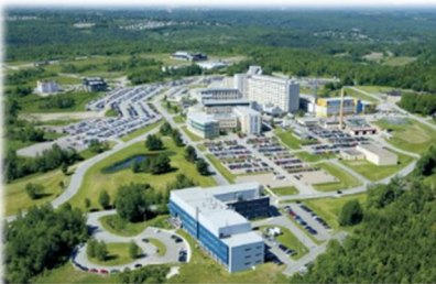
Campus de la santé, Sherbrooke