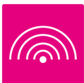
Équité - Diversité - Inclusion