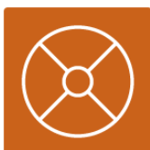
Santé et mieux-être des Premiers Peuples