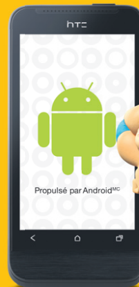
HTC One V