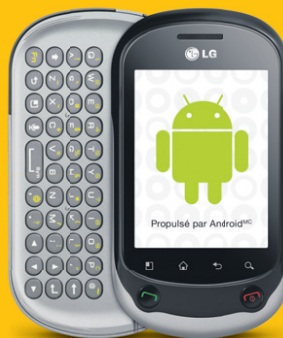
LG Optimus Chat

Faites vite! L'offre se termine le 5 juillet 2012.