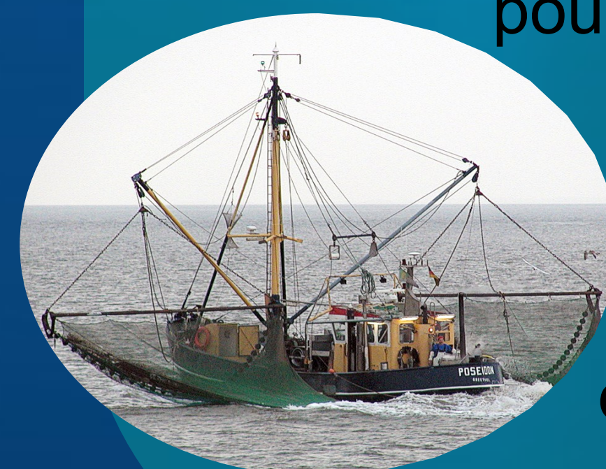
Inspiré de : Wikipedia, 2007 [13]

Ces pertes prennent en considération la diminution du nombre de poissons pêchés et de la valeur des captures ainsi que les bris d'équipements. [9][12]