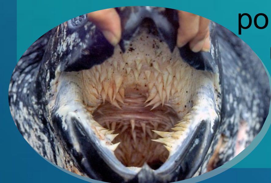
Inspiré de : Geographic Consulting's, 2013 [7]

Selon certaines études, la tortue luth régulerait les populations de méduses. Elle nous rend donc un service indirect, car ses proies ont un effet dévastateur sur les pêches, sur le tourisme et sur le domaine industriel. [3][5]