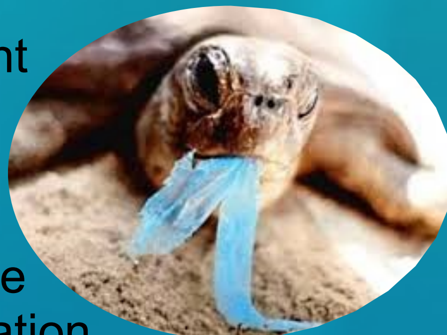
Inspiré de : Anonyme, 2011 [16]

Les débris de plastique représentent une grande menace pour les tortues luth. Ces déchets se retrouvent dans les océans et reviennent parfois vers les côtes par la force des courants. [5] Le plastique ingéré empêche la circulation normale de la nourriture dans le système digestif, ce qui affame ces reptiles. [6]