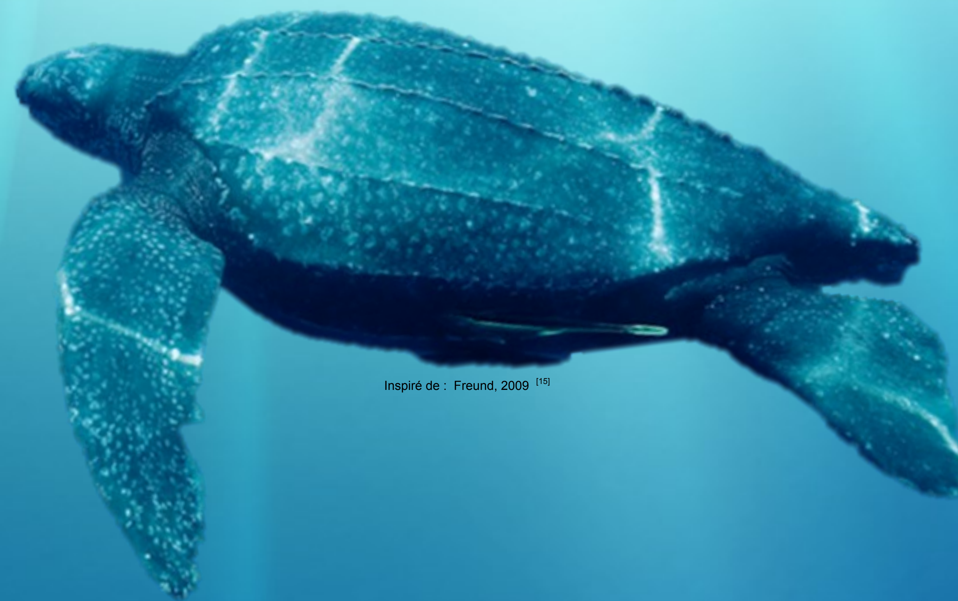
Inspiré de : Freund, 2009 [15]