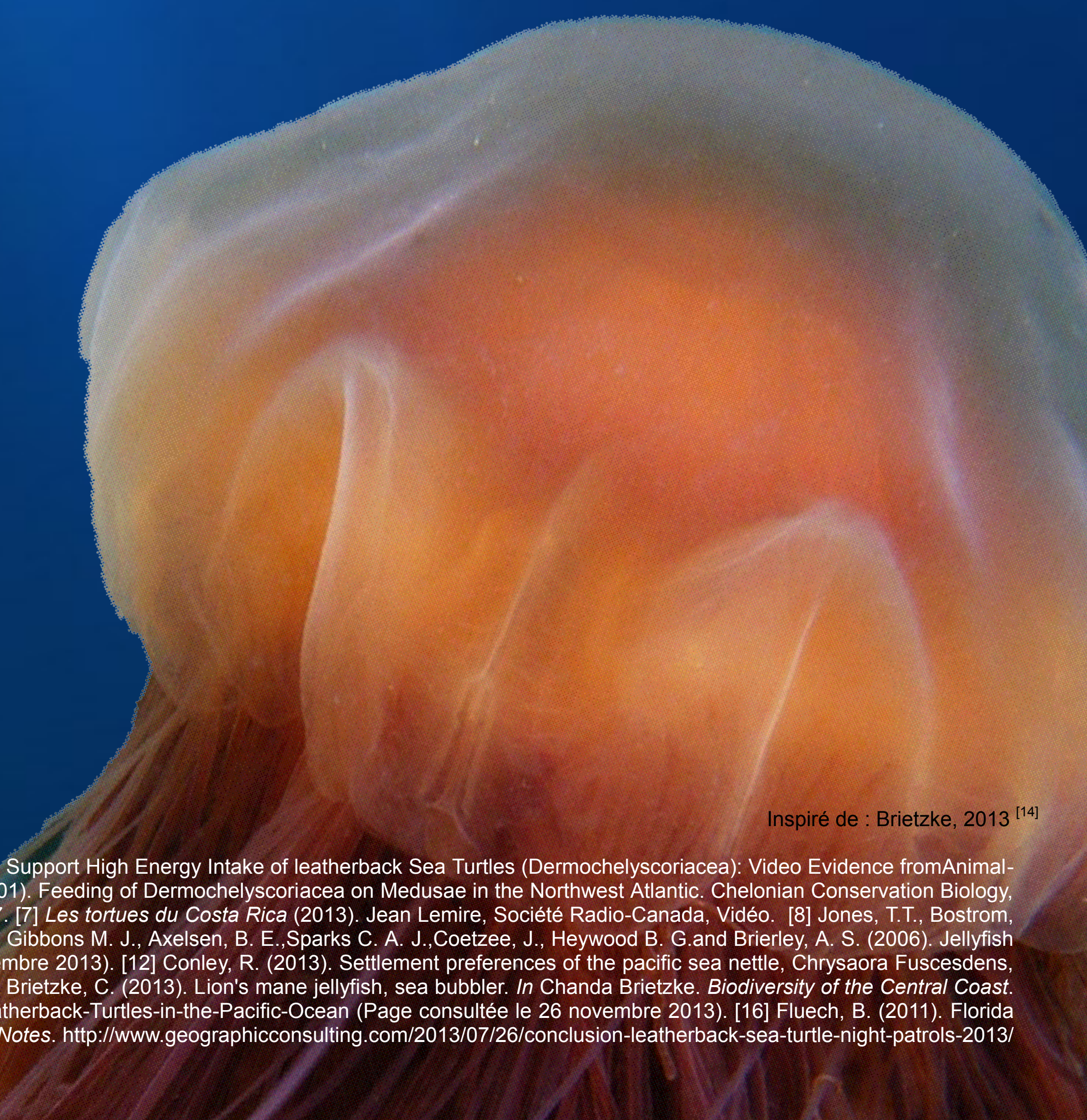
Inspiré de : Brietzke, 2013 [14]

En somme, il est impératif d'agir pour préserver la tortue luth, cet être utile à valeur intrinsèque. Le rehaussement des efforts concertés internationaux pour protéger et restaurer les populations de tortue luth sera capital pour sa survie. Au même titre, accroître la littérature scientifique à son propos pourrait favoriser un meilleur encadrement de la protection de l'espèce.