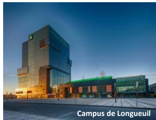
Campus de Longueuil

Le DESS en gestion de l'environnement forme des personnes professionnelles ayant une vision systémique et multidisciplinaire des enjeux environnementaux. Leur compréhension approfondie de différents domaines de pratique de l'environnement les rend aptes à concevoir des stratégies structurantes et adaptées afin de favoriser la transition socioécologique au sein des organisations et des communautés.