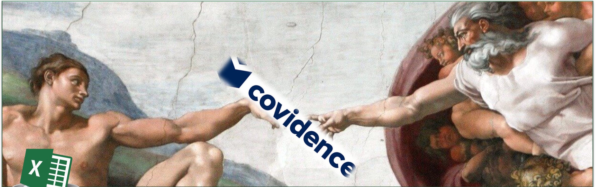
La création d'Adam, par Michel-Ange