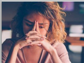
Profil de précarité