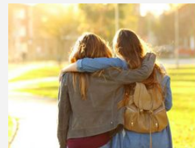
Profil de soutien

Plus haut niveau d'éducation Vivent en appartement Aucune ne bénéficient d'une prestation d'aide sociale