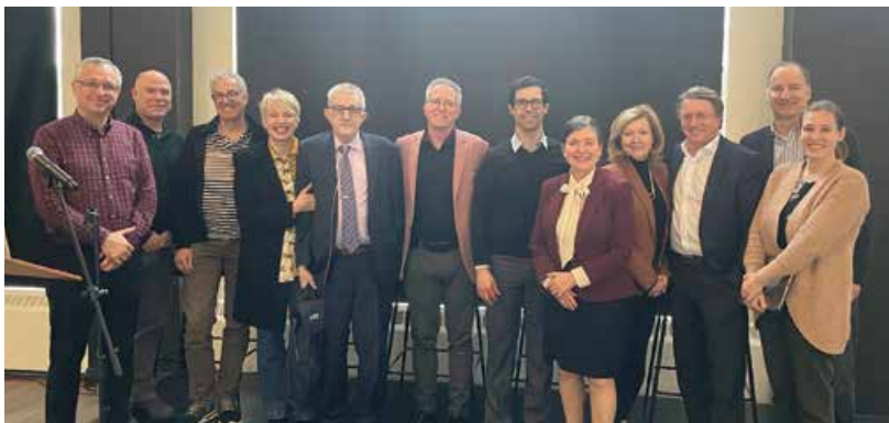
Activité scientifique grand public-reconnaissance patient partenaire DOCC