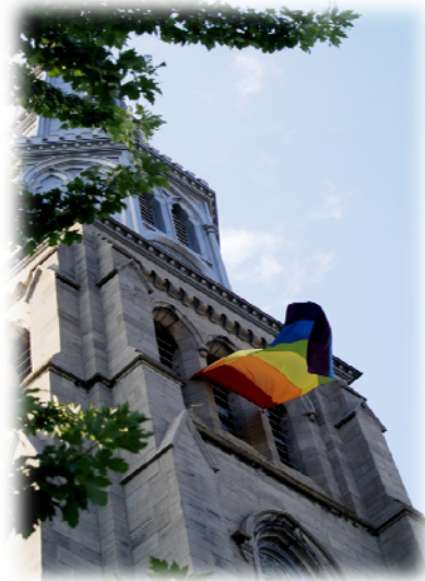
Clocher de l'église Saint-Pierre-Apôtre, Montréal