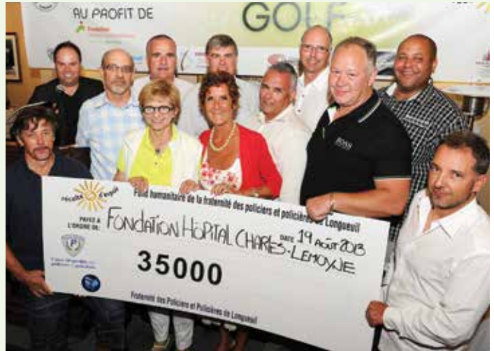
Les organisateurs du tournoi ainsi que les représentants de la Fondation et de l'Urgence sont visiblement satisfaits des retombées de l'événement.

Déjà dix ans pour le tournoi de golf de la Fraternité des policiers et policières de Longueuil ! Le 19 août dernier, près de 350 personnes se sont rassemblées dans le cadre de l' Omnium de golf de la Fraternité des policiers et policières de Longueuil . Cet événement amical a permis de recueillir la somme nette de 35 000 $ , des fonds destinés à bonifier les soins donnés aux patients de l'Urgence de l'Hôpital Charles-Le Moyne. Cela fait maintenant huit ans que la Fraternité choisit de consacrer les profits de son tournoi annuel au mieux-être de l'équipe de l'Urgence et de ses patients. Quotidiennement amenés à interagir avec le monde médical à titre de premiers répondants, les policiers et policières se sentent très interpellés par cette cause. Grâce à leur générosité, la Fondation a fait l'acquisition pour l'Urgence d'équipements diagnostiques permettant d'identifier plus efficacement les problèmes de santé rencontrés. Merci pour toutes ces années de fidélité et longue vie à cette union !