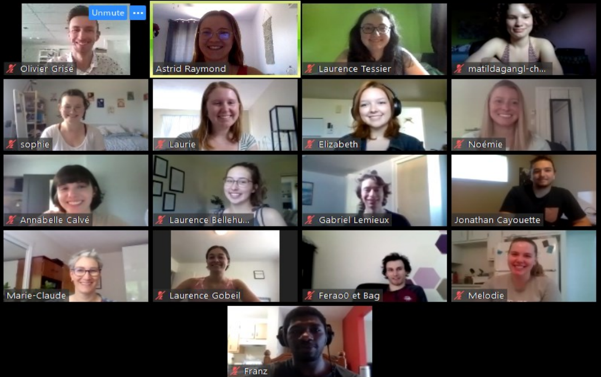
Une partie de notre cohorte de 2e année du baccalauréat