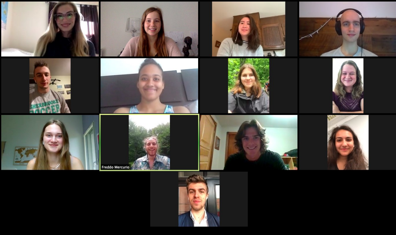
Une partie de notre cohorte de 1er année du baccalauréat