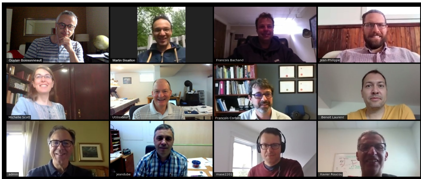
Nos professeurs au département