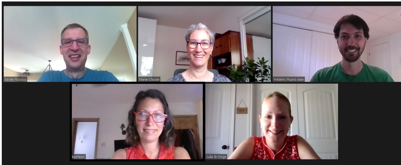
Équipe de gestion départementale et du baccalauréat

Vous les retrouverez également sur le site internet du département et du baccalauréat.