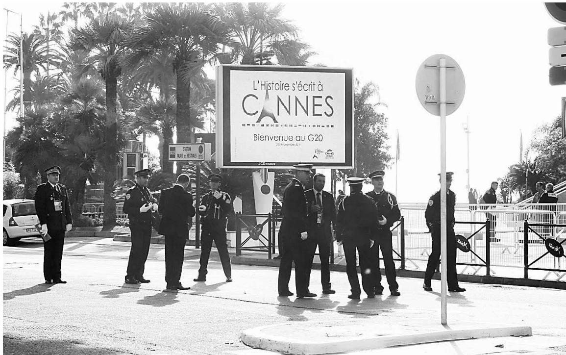
Des policiers bloquent l'accès à la Croisette et au front de mer de Cannes, où doit s'ouvrir demain le 6 e sommet du G20.

À sa création en 1999, sous l'impulsion de l'ancien ministre des Finances Paul Martin, le G20 se voulait un forum de discussion et d'échange entre les ministres des Finances des 20 plus grandes puissances mondiales afin de répondre à l'onde de choc causée par la crise asiatique de 1997.