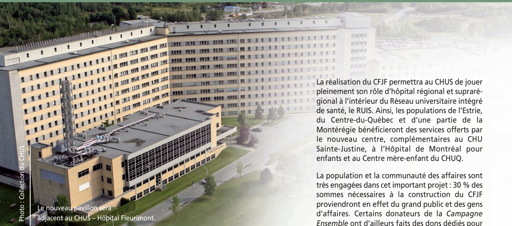
Le nouveau pavillon sera adjacent au CHUS – Hôpital Fleurimont.