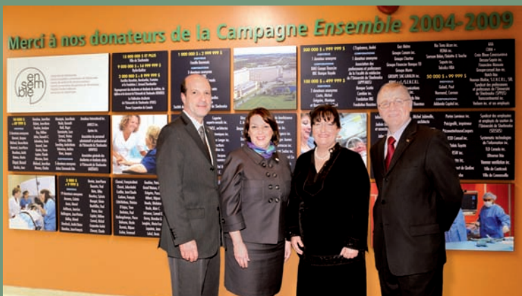
Tableau d'honneur CHUS