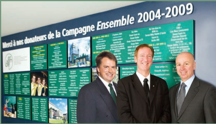
Tableau d'honneur Université de Sherbrooke

La puissance de cette campagne prend tout son sens lorsque l'on jette un coup d'œil au tableau d'honneur installé dans le Pavillon Georges-Cabana.