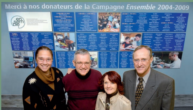
Tableau d'honneur CSSS-IUGS