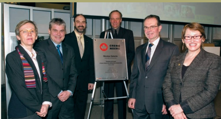
Le lancement officiel de la Chaire.