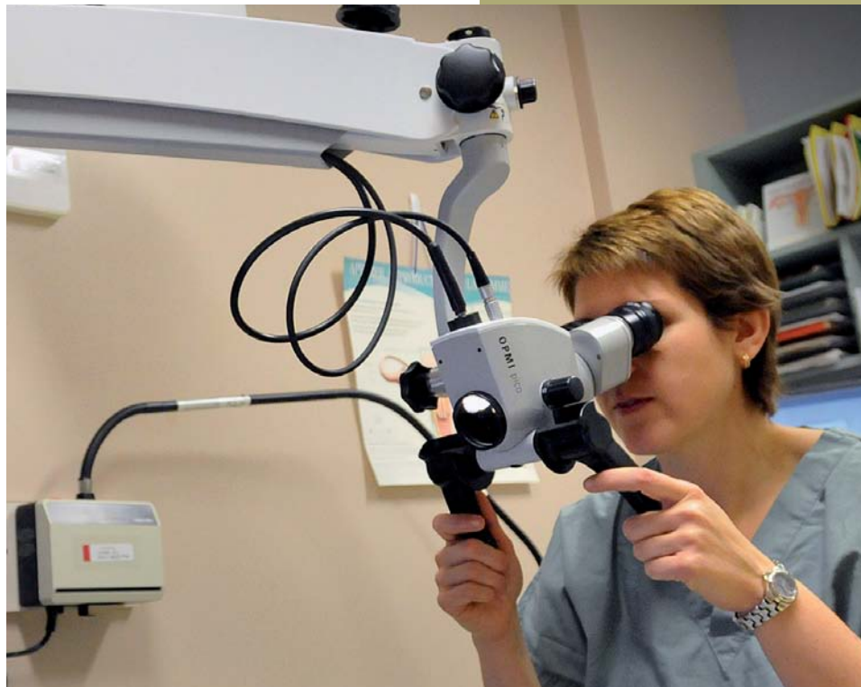
Équipement pour la salle de colposcopie