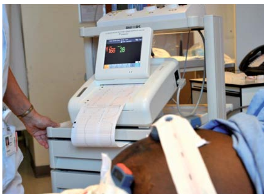
Moniteur fœtal et capteur à ultrasons pour la maternité

Les équipements médicaux spécialisés demandent de grands investissements, mais ils sont essentiels pour bien soigner les patients. Lors de la construction du Centre femme-jeunesse-famille, plus de 450 000 $ supplémentaires seront investis dans de nouveaux équipements : de sorte à augmenter l'accessibilité et accroître notre efficacité. Un grand merci en leur nom!