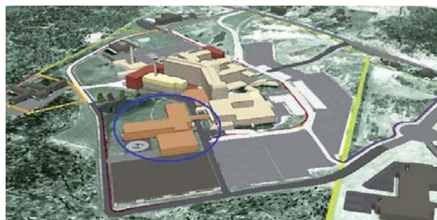
Esquisse du futur Centre femme-jeunesse-famille (encerclé)

La réalisation du Centre femme-jeunesse-famille permettra au CHUS de jouer pleinement son rôle d'hôpital régional et suprarégional à l'intérieur du Réseau universitaire intégré de santé, le RUIS, auprès de la population de l'Estrie, du Centre-du-Québec et d'une partie de la Montérégie, et ce, en étant complémentaire au CHU Sainte-Justine, à l'Hôpital de Montréal pour enfants du CUSM et au Centre mère-enfant du CHUQ.