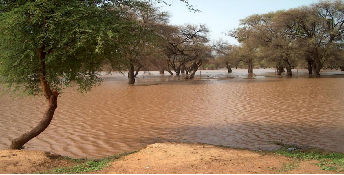
Figure 1.2 : Eaux de ruissellement drainées vers la mare alimentant les puits