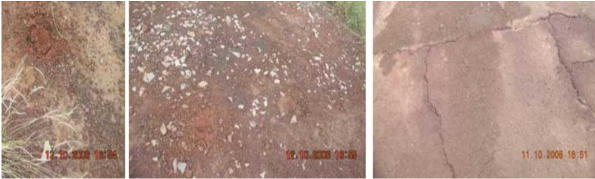
Figure 1.1 : Les traces de pollution potentielle observées sur le site - environ 50 cm sur les photos