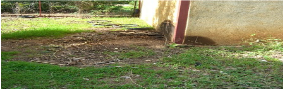
Figure 1.3 : Sol contaminé à l'extérieur d'un lieu de stockage à Molodo

Les coordonnées géographiques du site sont les suivantes : 14° 30' 54,3 " Nord et 004°05' 07,8 Ouest (PALUCP, 2006).