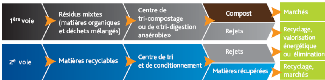
Figure 1.1 Approche de collecte à deux voies.

Pour la première, la collecte mixte, les citoyens n'ont pas à séparer les matières organiques car elles sont ramassées simultanément avec les résidus ultimes. Cette approche diminue les efforts requis pour les citoyens et représente une économie relative au transport en comparaison avec une collecte porte-à-porte des matières organiques triées à la source. La séparation des matières organiques se fait au centre de traitement sur une chaîne de tri spécialisée en vue de produire du compost, une méthode appelée le tri-compostage (figure 1.1).