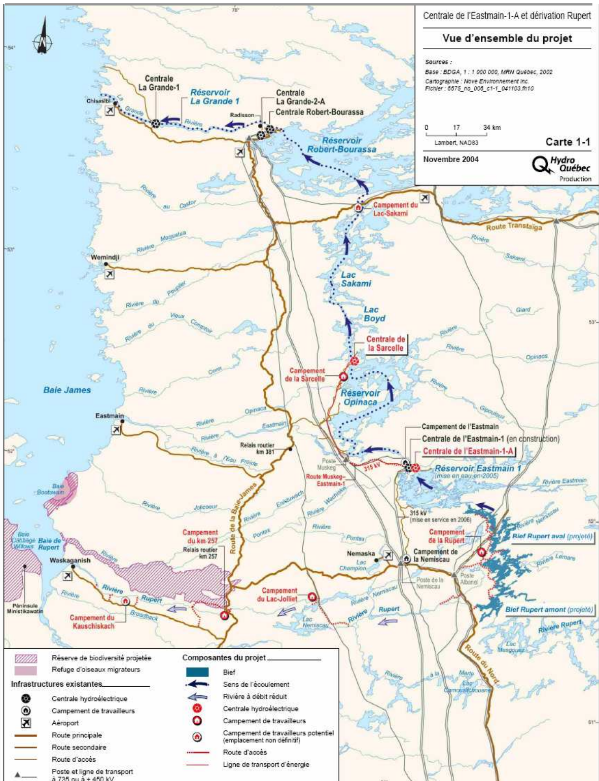
Figure 1.1 : Composantes du projet Eastmain-1-A – Sarcelle – Rupert