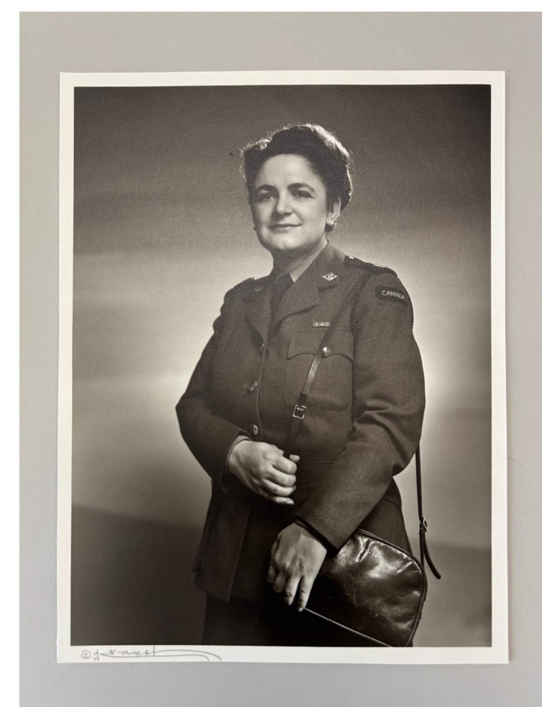
« Cécile-Éna Bouchard »