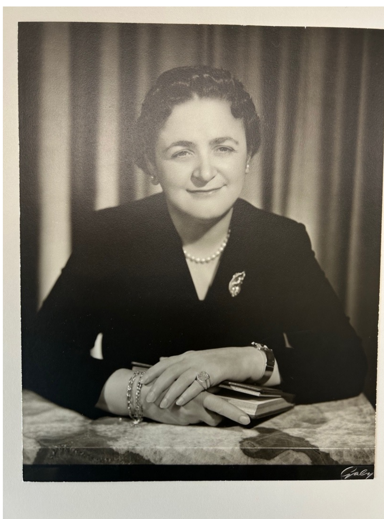
« Cécile-Éna Bouchard »