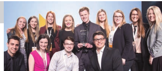
Les membres de l'équipe qui étaient présents à Toronto.

Lors de sa 2 e participation à une compétition nationale Enactus, le jeune groupe de l'UdeS, dont une grande majorité des membres sont étudiants de la Faculté de droit, a remporté plusieurs prix, parvenant d'ailleurs à se classer parmi les 20 meilleures équipes canadiennes. L'événement organisé par Enactus Canada, regroupant plus de 1 500 étudiants, professeurs et entrepreneurs établis, s'est déroulé du 2 au 4 mai 2016 au Palais des congrès de Toronto.