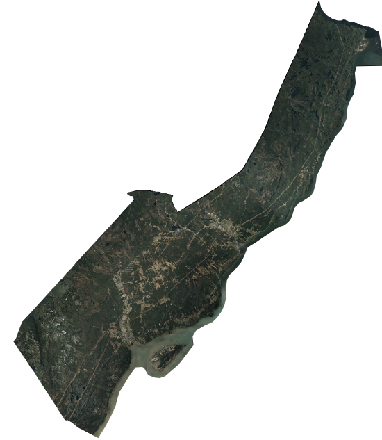
1 mosaïque du projet