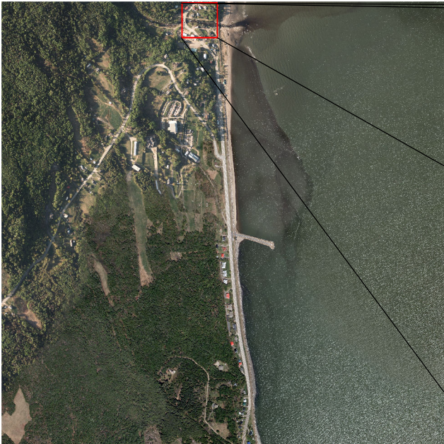
835 orthophotographies en couleur (4 km 2 )