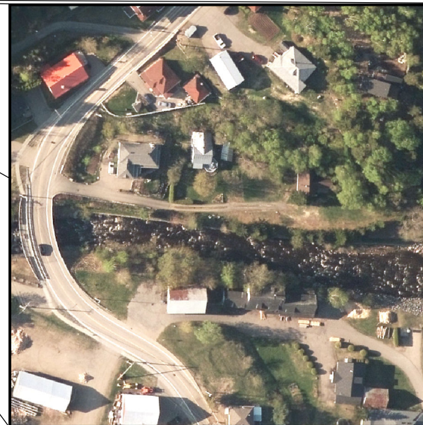
Résolution de 20 cm