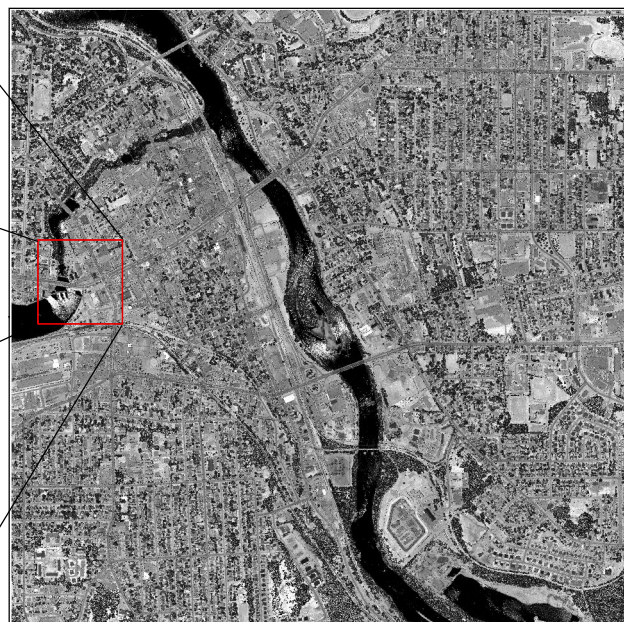
120 images d'intensité de 9 km 2