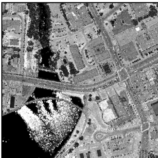
Zoom sur une image d'intensité Précision de 15 à 25 cm