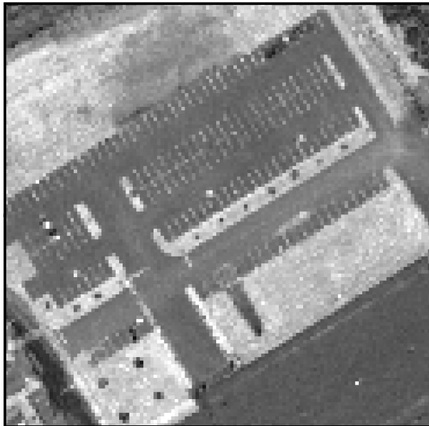
Zoom sur une image d'intensité Précision de 15 cm