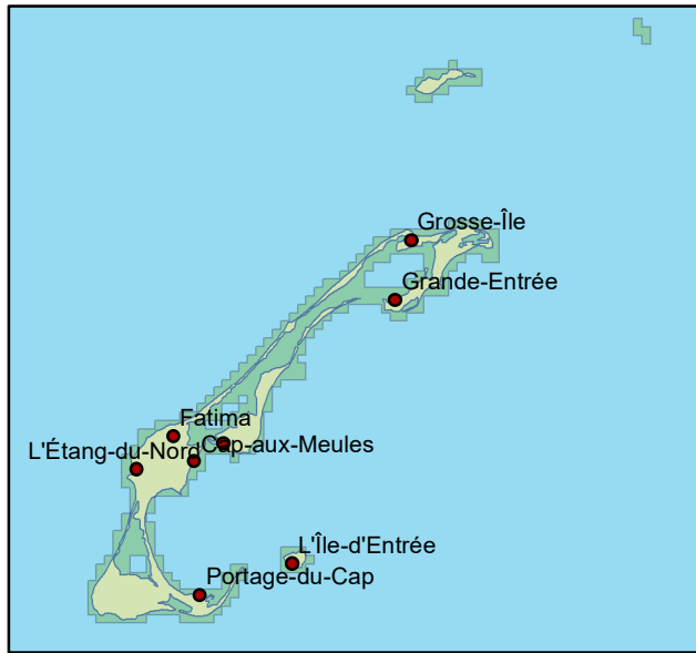
Limites du projet