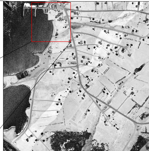
477 images d'intensité de 1 km 2