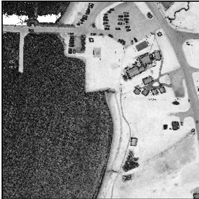
Zoom sur une image d'intensité Densité de 6 points/m 2